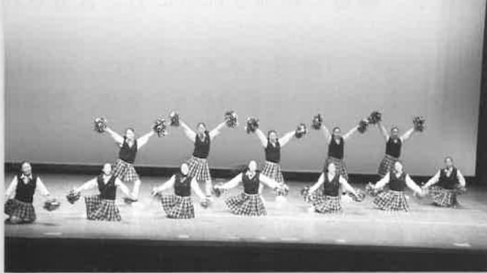
明秀学園日立高校ブルーフェアリーズ