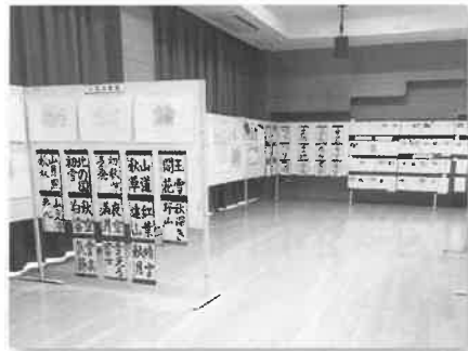
子どもたちの作品