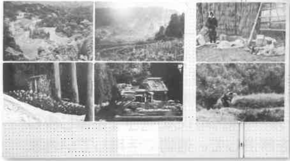
十王フォト愛好会