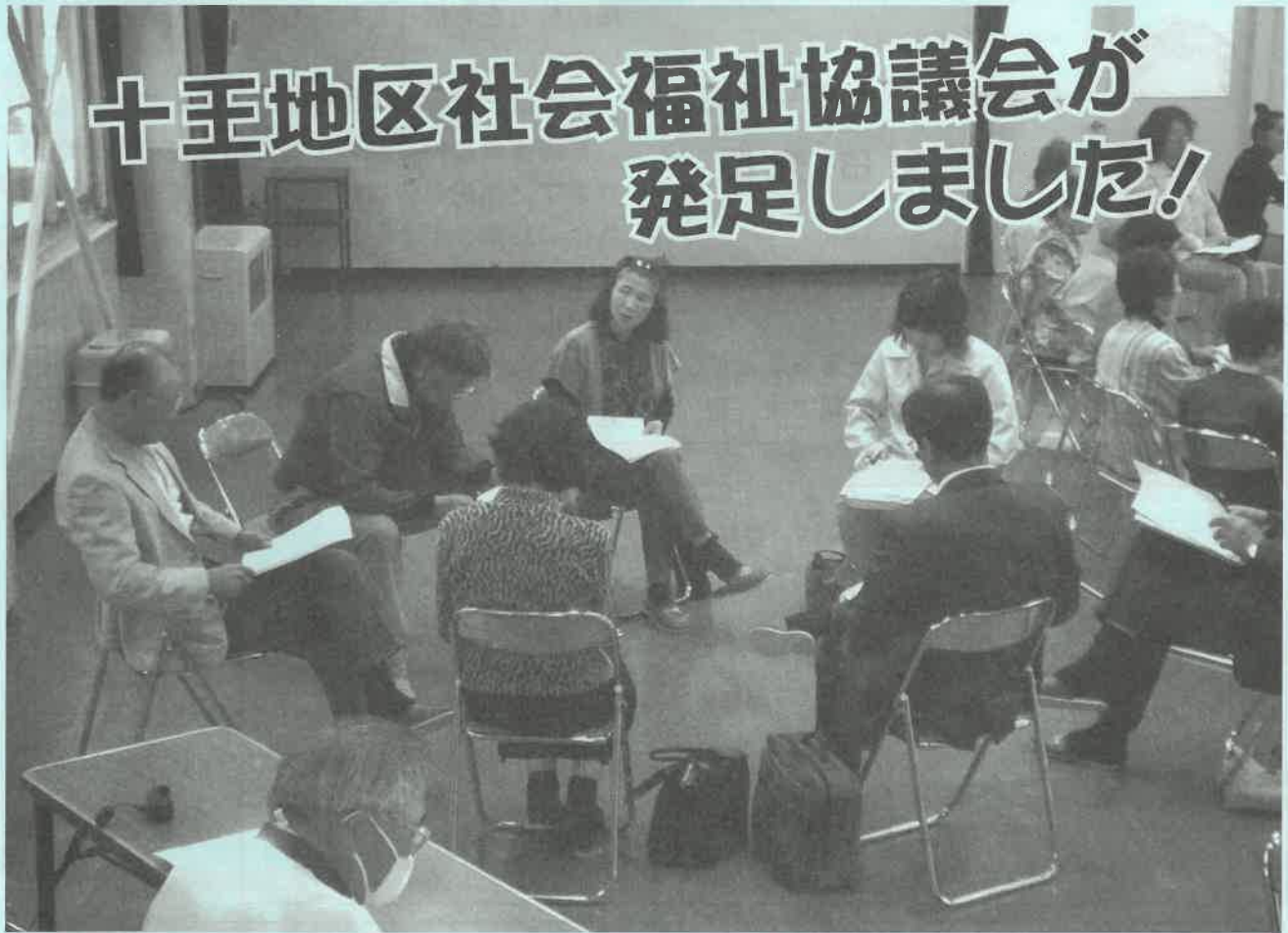
十王地区社会福祉協議会が発足しました